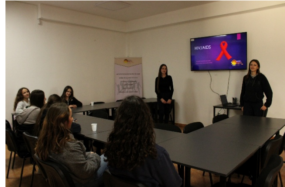
Zhvilluar me 1 Dhjetor 2025